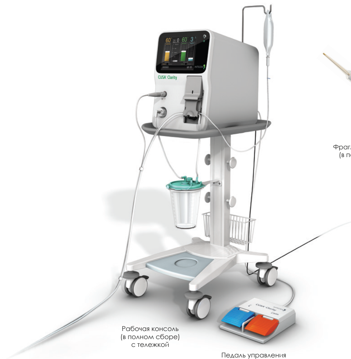
Рабочая консоль (в полном сборе) с тележкой