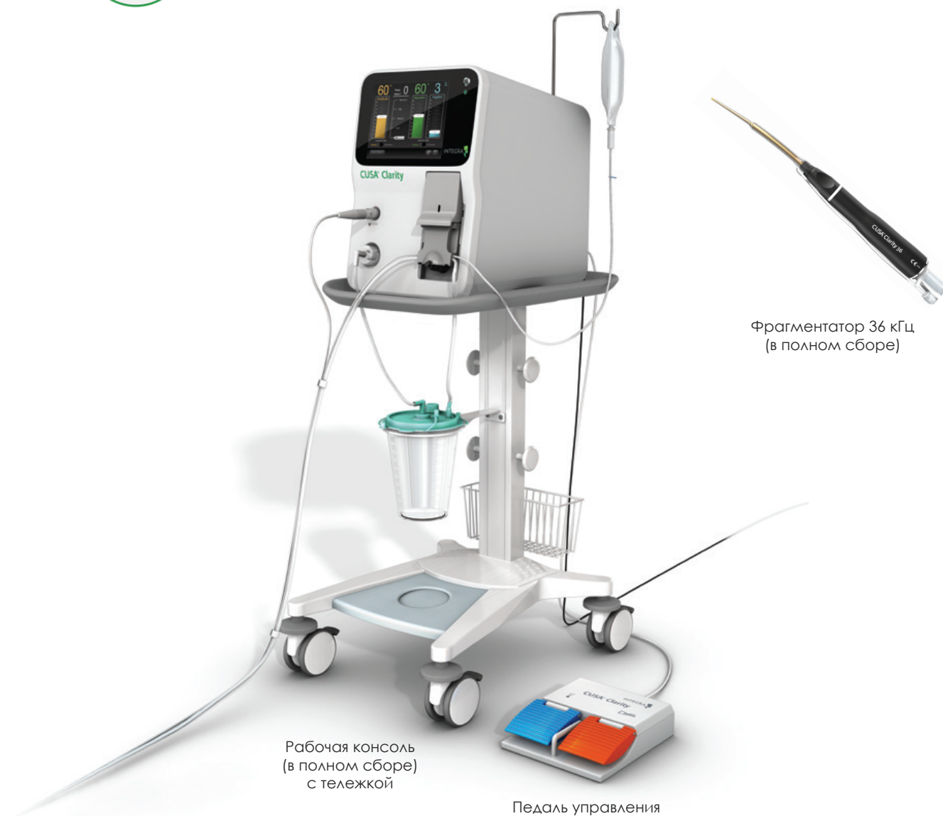
Рабочая консоль (в полном сборе) с тележкой